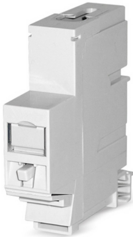
Rail adapter voor 1 RJ45 module MS-K 1/8 of MS-K Plus 1/8

voor 1 RJ45 module MS-K 1/8 of MS-K Plus 1/8