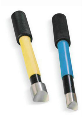
Outils pour ouvrir des entrées de câble