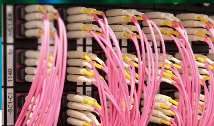
DÄTWYLER DATACENTER SOLUTION (FO-DCS)