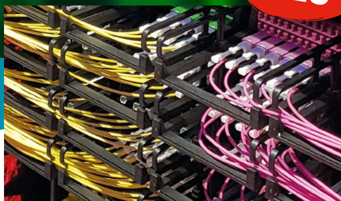
HIGH-DENSITY DATACENTER SOLUTION (HD-DCS)

Die FO-DCS ist eine zukunftssichere, vorkonfektionierte Plug-and-Go-Glasfaserlösung, die sich durch hochwertige Kabel und Komponenten und eine hochpräzise Steckerkonfektion auszeichnet. Aufgrund ihrer exzellenten optischen und geometrischen Werte eignet sie sich für alle aktuellen sowie für zukünftige High-Speed-Anwendungen im Datacenter. Modulare, beliebig kombinierbare Bauteile bieten Anwendern ein Höchstmaß an Design-Flexibilität.